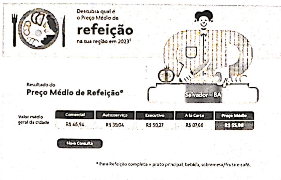
Figura 1.

Conselho de Arquitetura e Urbanismo da Bahia